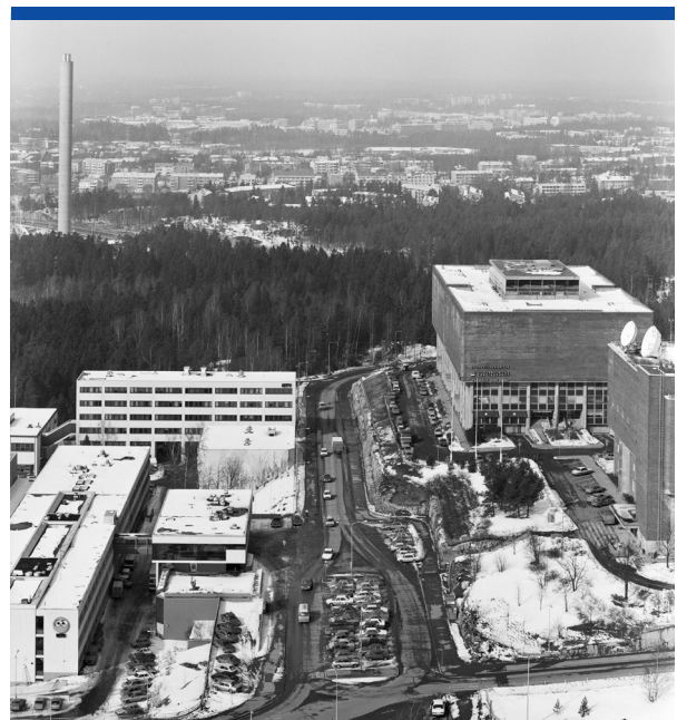
MTV:n toimitilat Helsingin Pasilassa tunnetaan Pöllölaaksona. 1980-luvulla MTV:n uutiset aloittivat deregulaation myötä toimintansa ja televisiossa alkoi kuuluisa uutisklipailu.